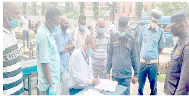
बढी मूल्यमा प्याज बिक्री गर्ने लहान नगरपालिका-३ का गंगा ट्रेडर्समा शिलबन्दी गर्दै ।

कालोबजारी गरिएको पाइएपछि गोलबजार नगरपालिका-४ का जयलक्ष्मी