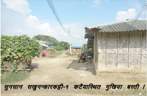
सुनसान सखुवानन्कारकट्टी-१ कटैयास्थित मुखिया बस्ती।